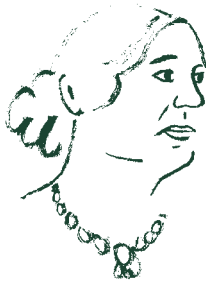
Delphine de Girardin